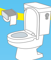
トイレクリーニング