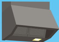
レンジフードクリーニング