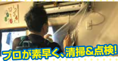
プロが素早く、清掃&点検!