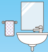
洗面台クリーニング