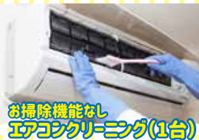
お掃除機能なし エアコンクリーニング(1台)