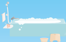
お風呂クリーニング