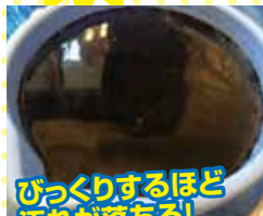
びっくりするほど 汚れが落ちる!